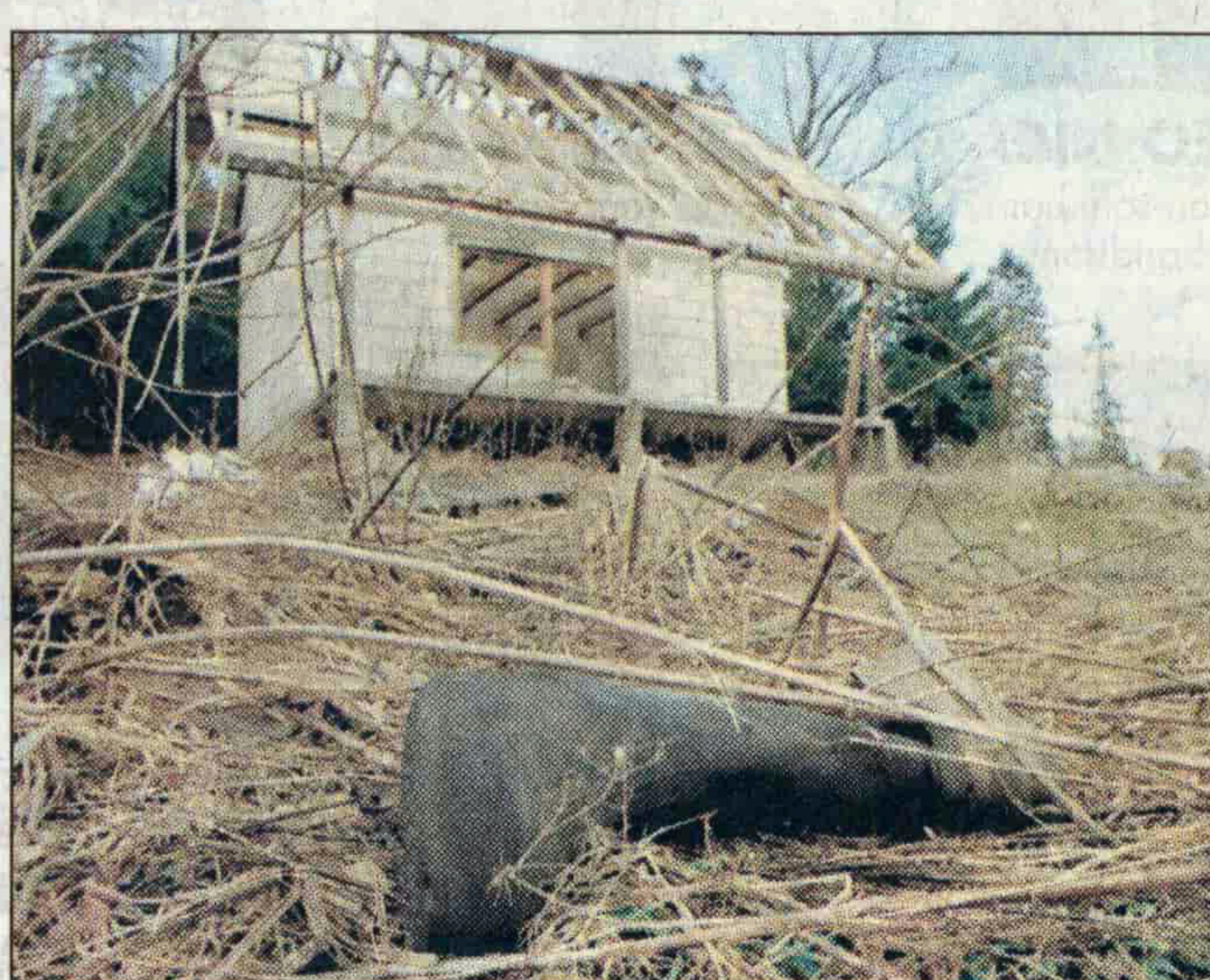
Stövel avslöjar. En ensam stövel markerar platsen för den massgrav som hittades i slutet av januari i Bosnien. Överlevande från ett serbiskt fångläger uppger att stympade kroppar dumpades där någon gång under 1992.

Natten mellan den 18 och 19 november 1991 föll den kroatiska Donaustaden Vukovar efter en tre månader lång