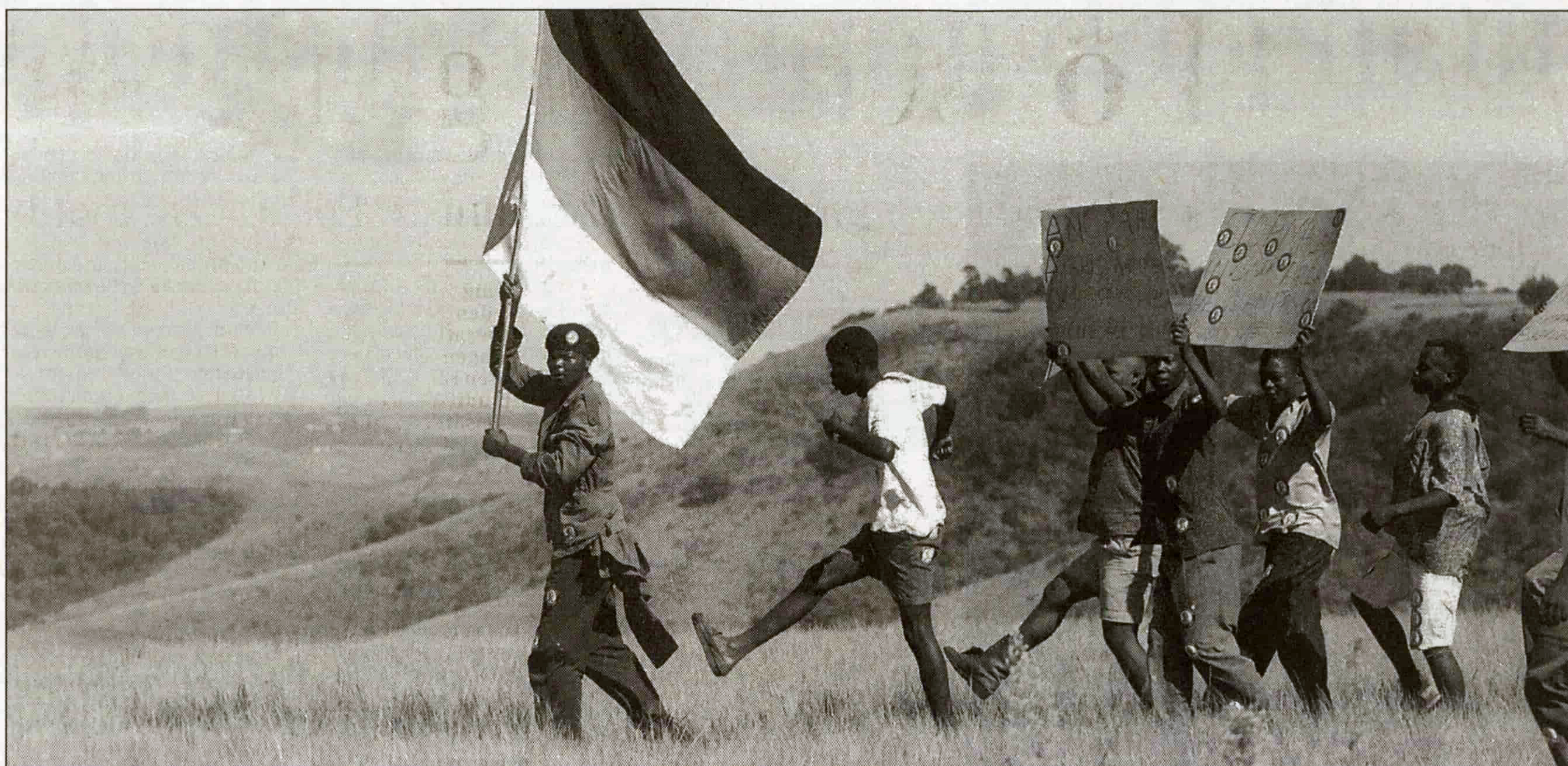
Markerar revir. ANC-anshängare eldar på med kampsånger och slagord inför mötet i Ndwedwe i Natalprovinsen i Sydafrika.