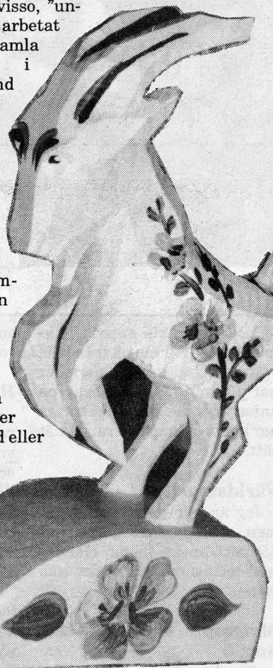
Nydekorerad med färgerna blått och gult och lite grönt sträcker sig vår hälsingebock mot skyn.