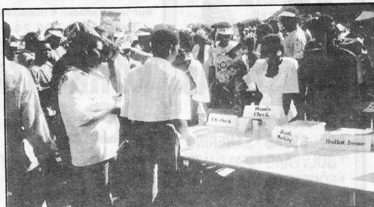
Sydafrika saknar demokratisk tradition. Här "utbildas" väljarna i hur valet kommer att gå till. Handen kollas, sedan förses den med en stämpel så att ingen kan rösta mer än en gång. Röstlängder finns inte.