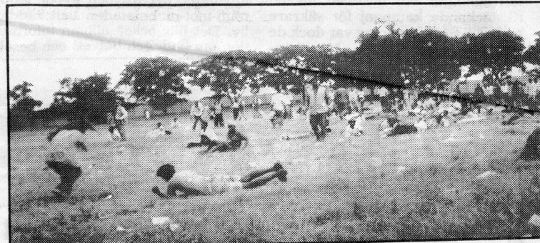
Under ett ANC-möte utbröt skottlossning, och folk kastade sig ner på marken.