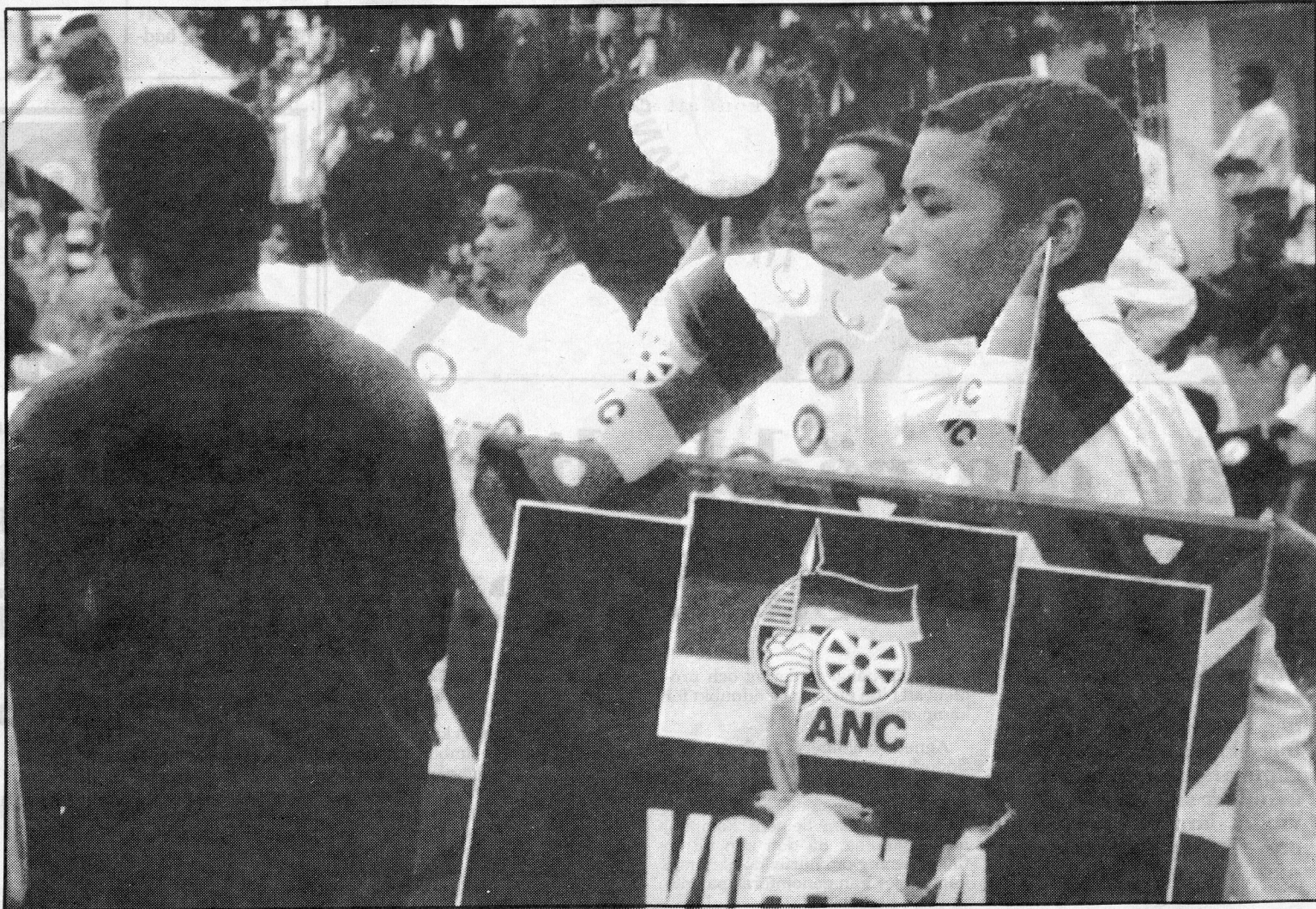
African National Congress går mot en säker seger i det sydafrikanska valet. Men inom befrielse rörelsen ANC finns många åsikter om den fortsatta färdriktningen.